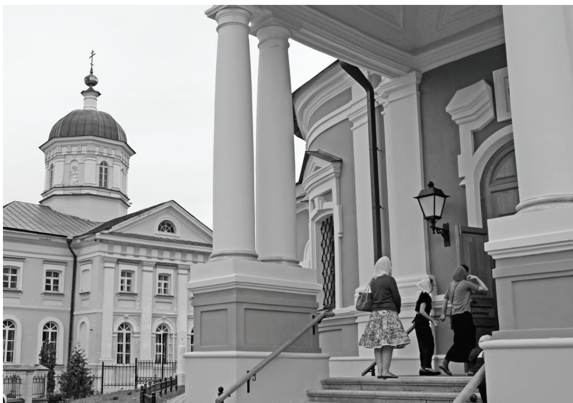
Вход в главный храм - Введенский.