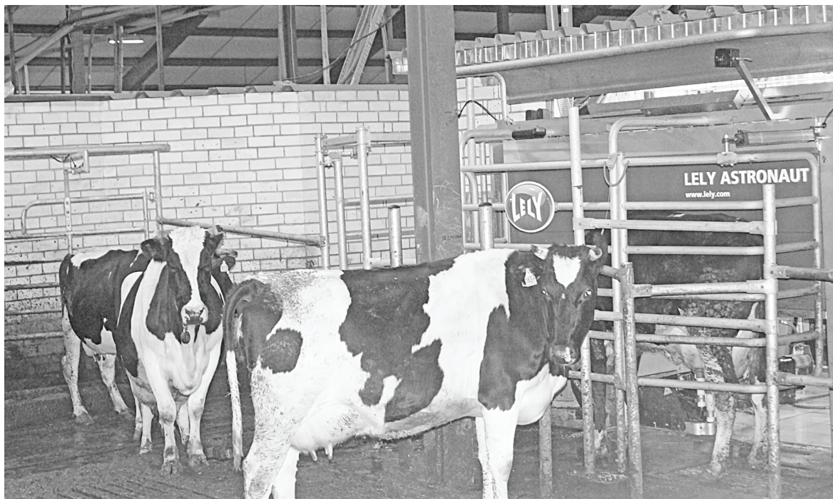
Коровы стоят в очереди на доение.

Когда в августе в с.Хотьково начала свою работу первая в нашем районе роботизированная ферма, планировалось, что на комплектование ее поголовья потребуется около года.