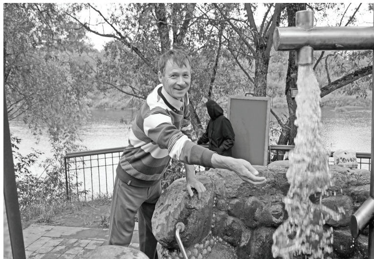
На источнике Сергия Радонежского.